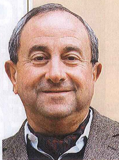
Jean Abeille Château Mont-Redon à Châteauneuf-du-Pape (Vaucluse)