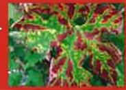
Fig. 1 : Pourcentage moyen d'expression des symptômes foliaires de l'esca par an et par cépage

Total = moyenne des parcelles de cabernet-sauvignon (CS) et de mourvèdre (M). Les analyses ont été menées par an et par cépage. Les différentes lettres au-dessus des barres indiquent les différences significatives entre les graphes (à P < 0,05 ).