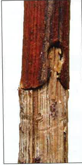
▲ De gauche à droite : greffe en fente pleine ; greffe anglaise ; greffe oméga.

Le greffage oméga représente 95% du greffage actuel. Les machines à greffer permettent de couper et d'assembler le porte-greffe et le greffon en une seule manipulation. La mécanisation du processus de greffage réduit considérablement les