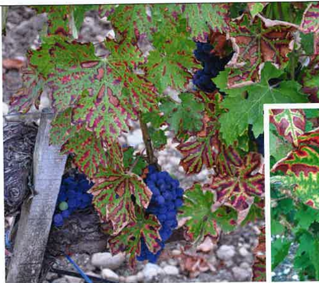
< Symptômes foliaires internervaires de la forme lente de l'esca.

Parmi les maux qui ravagent les vignobles du monde entier, il en est un qui effraie les viticulteurs depuis le temps des tout premiers vins : l'esca. Ce syndrome complexe est très étudié tout autour du globe, mais malgré cela, aucun moyen de lutte pleinement satisfaisant n'a encore été trouvé. Toutefois, même si les facteurs biotiques ou abiotiques pouvant favoriser ou freiner son développement sont connus et multiples : choix du porte-greffe, du cépage, système de conduite, type de taille (voir p. 20), âge de la parcelle, contrainte hydrique, type de sol... (Destrac-Irvine A., Laveau C., Goutouly J.-